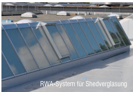
RWA-System für Shedverglasung