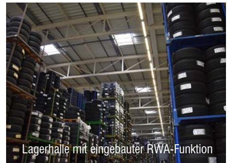
Lagerhalle mit eingebauter RWA-Funktion

Unser Services-Team ist täglich für die Inbetriebnahme und Wartung von RWA-Anlagen sowie für Steuerungen in der ganzen Schweiz unterwegs. Kontaktiere uns direkt per E-Mail unter info@isba.ch oder per Tel. +41 61 761 33 44, wir beraten Dich gerne individuell.