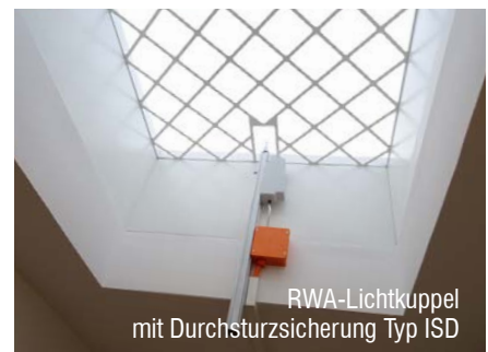
RWA-Lichtkuppel mit Durchsturzicherung Typ ISD