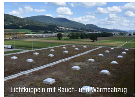
Lichtkuppeln mit Rauch- und Wärmeabzug