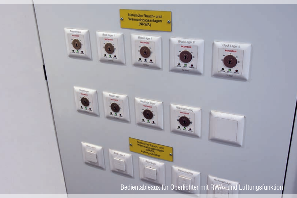
Bedientableaux für Oberlichter mit RWA- und Lüftungsfunktion