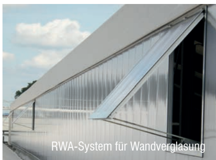
RWA-System für Wandverglasung