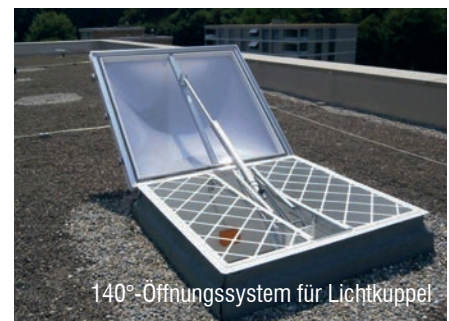
140°-Öffnungssystem für Lichtkuppel