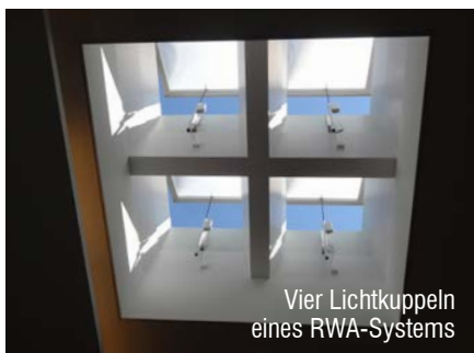
Vier Lichtkuppeln eines RWA-Systems

Lichtkuppel mit Kettenantrieb als Rauch- und Wärmeabzugssystem