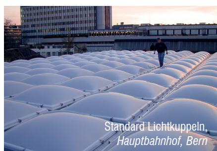
Standard Lichtkuppeln, Hauptbahnhof, Bern