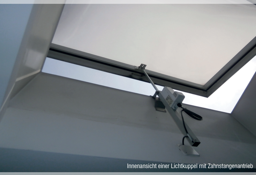
Innenansicht einer Lichtkuppel mit Zahnstangenantrieb