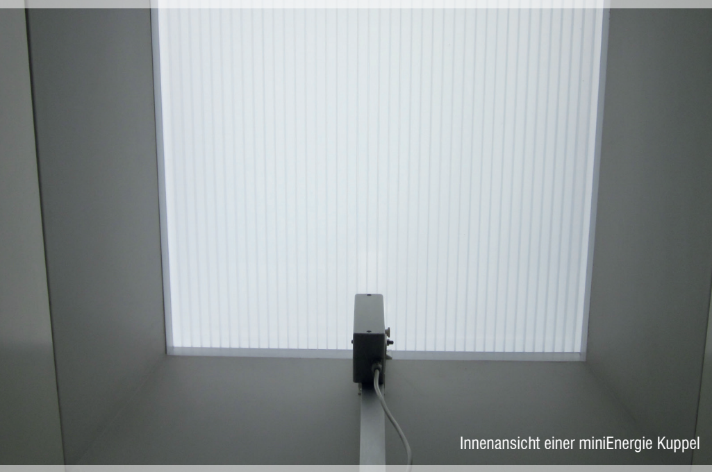
Innenansicht einer miniEnergie Kuppel