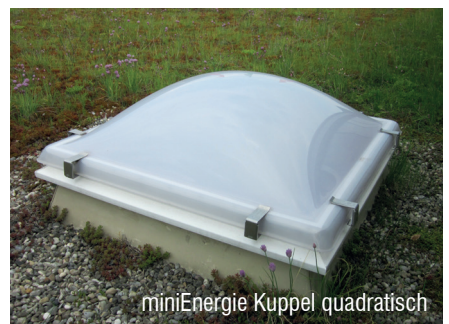
miniEnergie Kuppel quadratisch