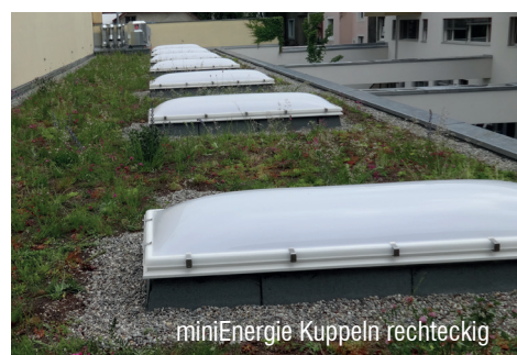
miniEnergie Kuppeln rechteckig