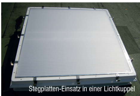
Stegplatten-Einsatz in einer Lichtkuppel