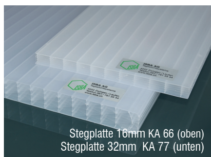
Stegplatte 16mm KA 66 (oben) Stegplatte 32mm KA 77 (unten)