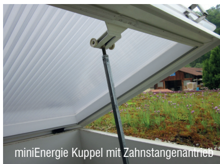
miniEnergie Kuppel mit Zahnstangenantrieb