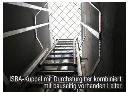
ISBA-Kuppel mit Durchsturgitter kombiniert mit bauseitig vorhanden Leiter