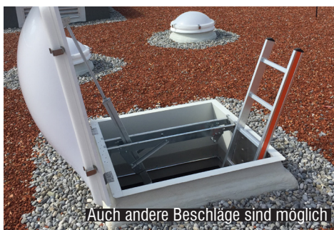
Auch andere Beschläge sind möglich