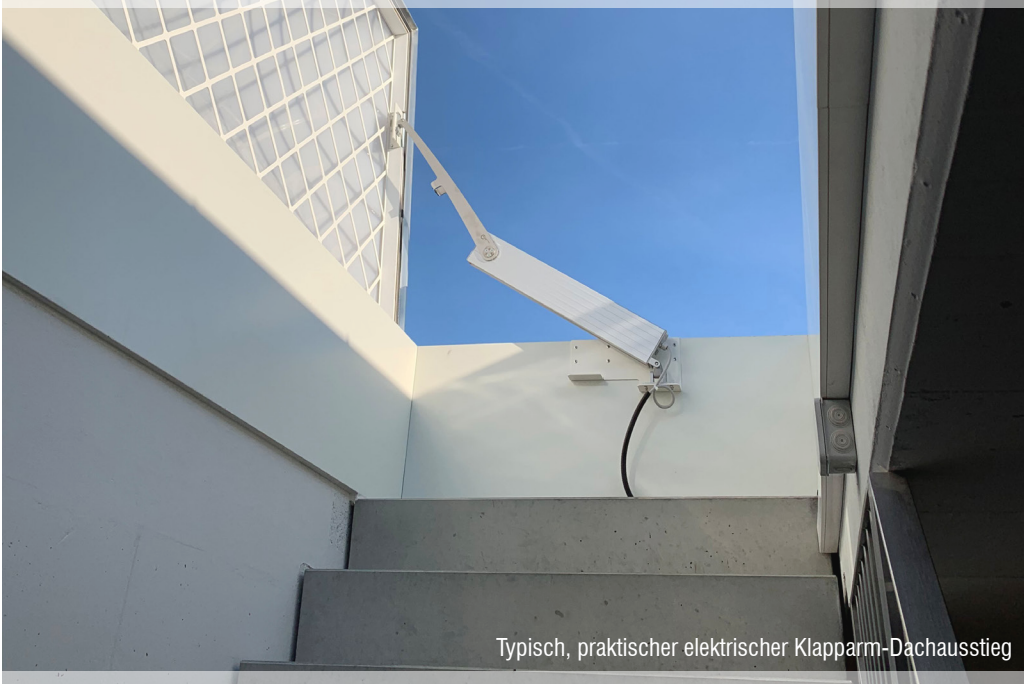
Typisch, praktischer elektrischer Klapparm-Dachausstieg