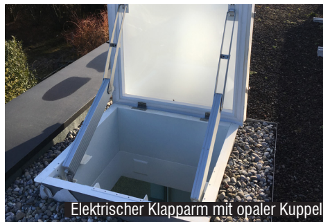
Elektrischer Klapparm mit opaler Kuppel