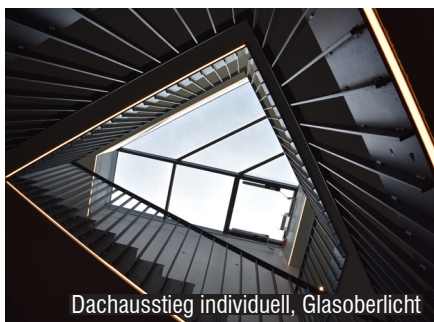
Dachausstieg individuell, Glasoberlicht