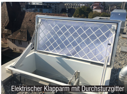
Elektrischer Klapparm mit Durchsturzgitter

Elektrischer Klapparm für Flachdachfenster