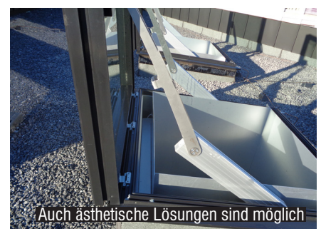
Auch ästhetische Lösungen sind möglich