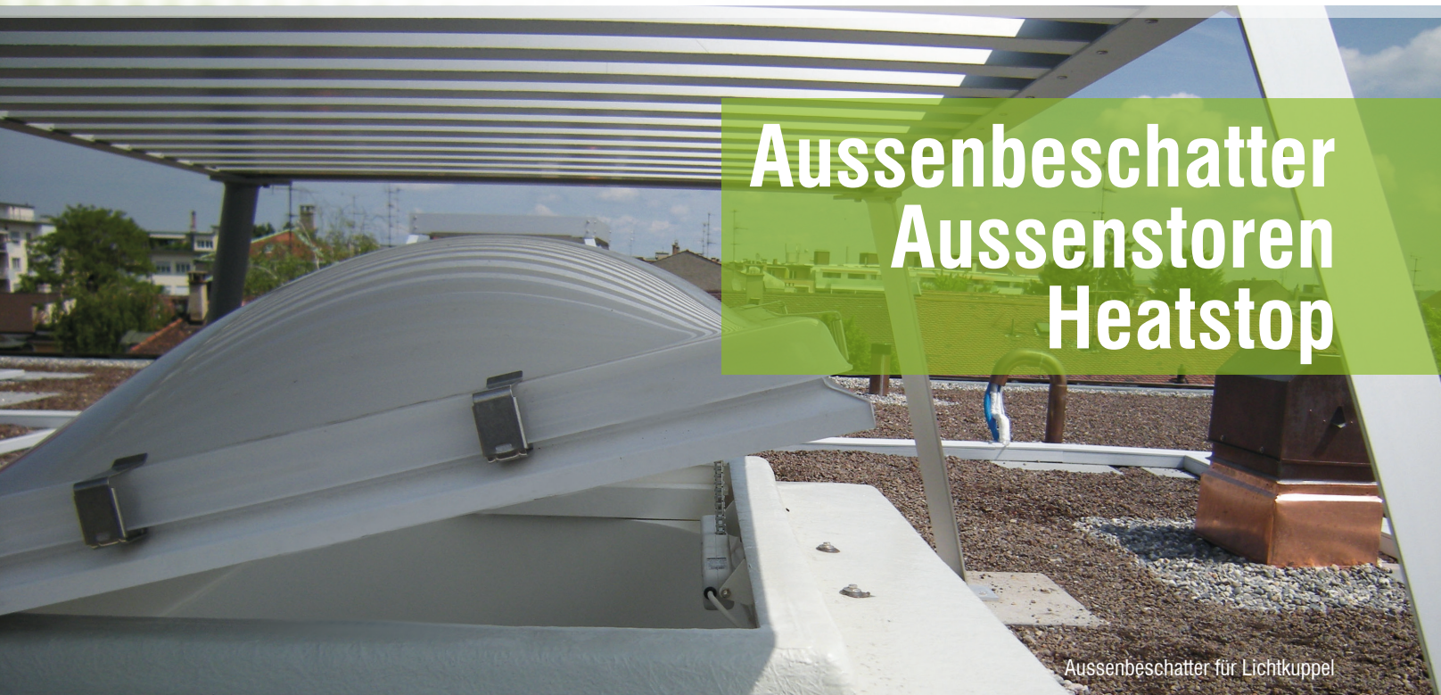
Aussenbeschatter für Lichtkuppel