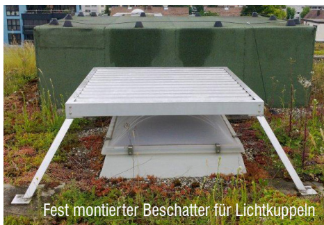
Fest montierter Beschatter für Lichtkuppeln